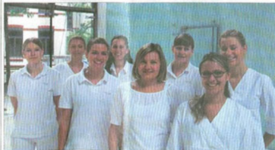
Mitarbeiterinnen der Zahnklinik ABC Bogen

Zahnklinik ABC Bogen ABC Straße 19 20354 Hamburg Tel. 040/ 35 00 41 40 Fax 040 / 35 00 41 11 info@zahnklinik-abc-bogen.de www.zahnklinik-abc-bogen.de