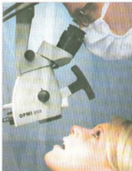
Moderne Technik für sichere Diagnose

Durch Zahnfleischerkrankungen gehen mittlerweile weit mehr Zähne verloren, als durch Karies. Der Grund: Mehr als 30 Prozent aller Erwachsenen in Deutschland haben Parodontose.